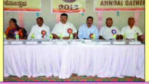
मंच पर अतीथी अने अतीथी विशेष तथा महानुभावों