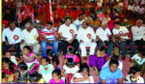
मेणावडा मां पधारेल महानुभावो