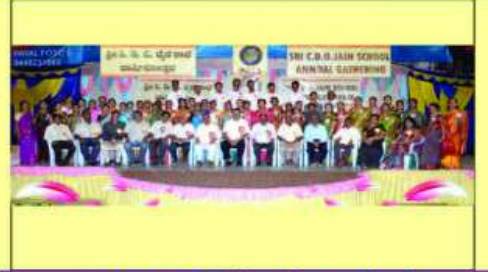
स्कुलना कमीटी मेम्बरु तथा शिक्षको