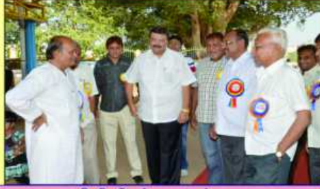
अतीथीश्री नुं स्कुल मां आगमन