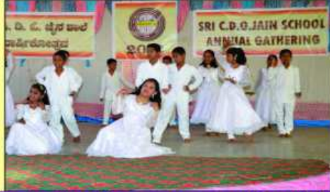
सांस्कृतिक कार्यक्रम रजु करता नाना विध्यार्थीओ