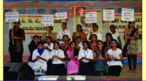
सांस्कृतिक कार्यक्रम रजु करता मोटा विध्यार्थीओ