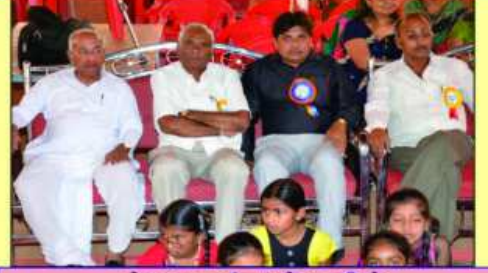
मेणावडा मां पधारेल वडीलो