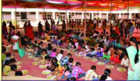
जमराणी भोज माणता विध्यार्थीओ